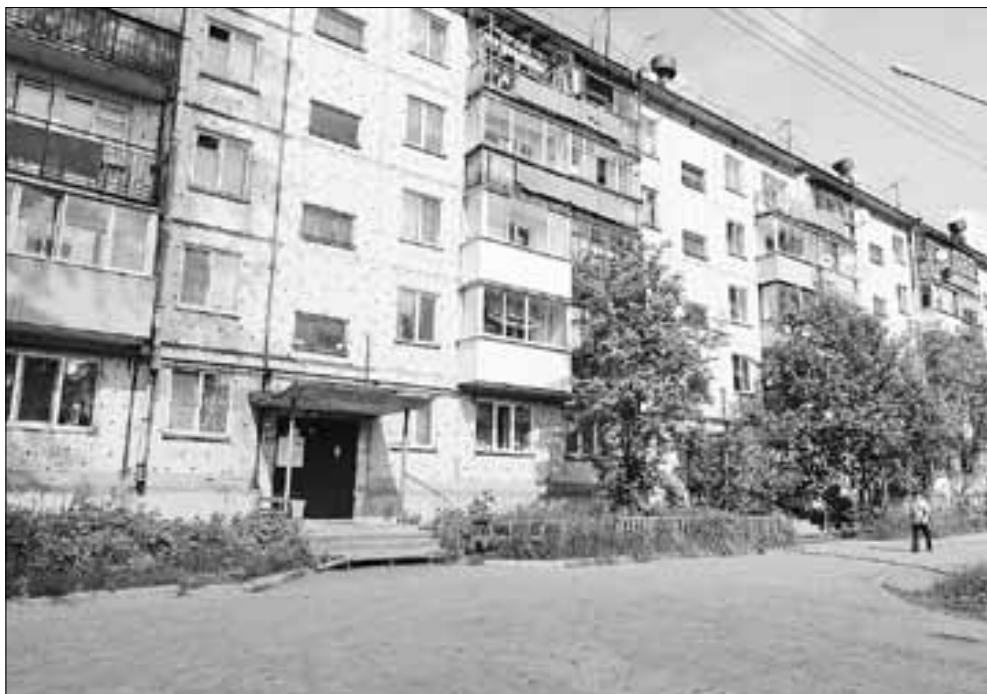
■ Двор на Штурманской, 3 скоро преобразится