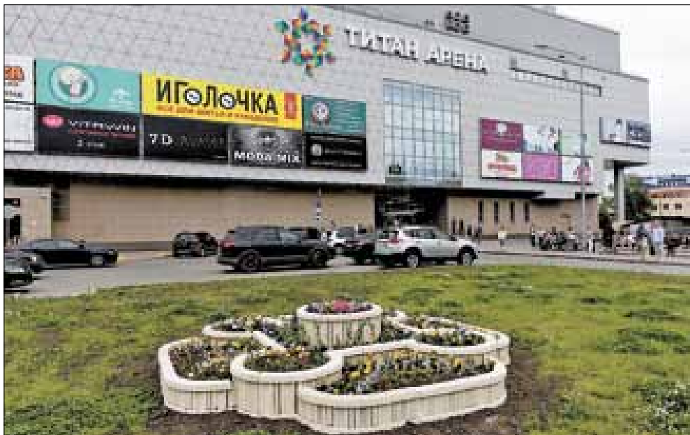
■ На территории у «Титан Арены» постоянно ведется благоустройство, недавно установили большую клумбу, а скоро преобразится и газон

Новый формат торговли – это не просто покупки, но и организация семейного досуга, увлекательного времяпрепровождения и социальная ответственность перед городом