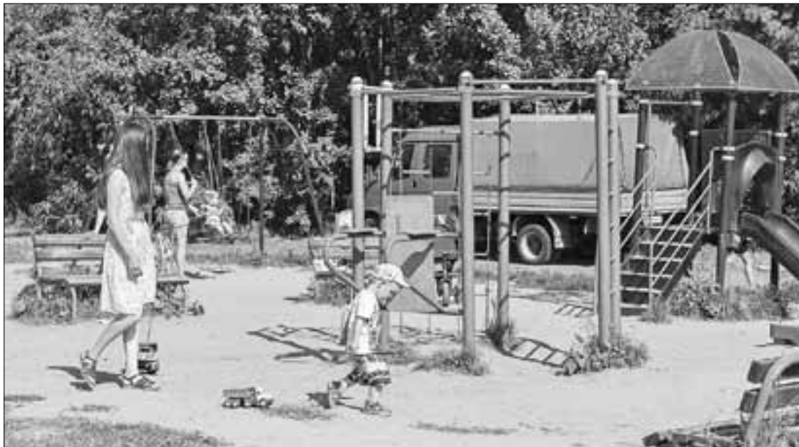
■ Даже днем на детской площадке малышей не стоит оставлять без присмотра взрослых.

Профилактическое направление принесет масштабный результат тогда, когда найдет отклик в каждом человеке, а мы должны создать для этого все условия.