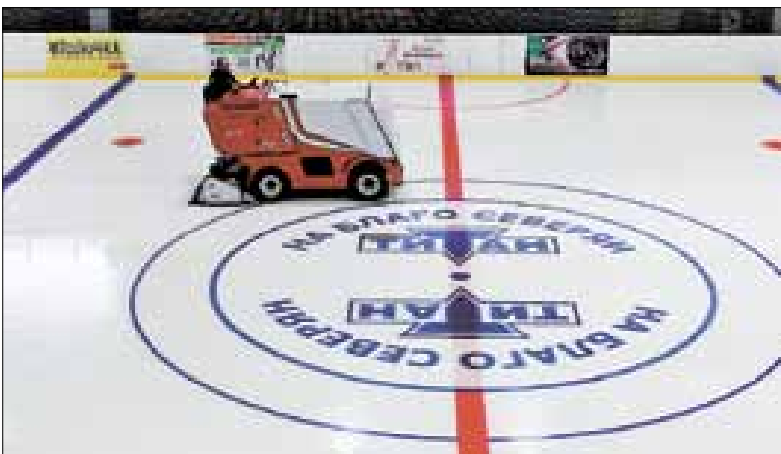
■ Ледовая арена расположена на четвертом этаже