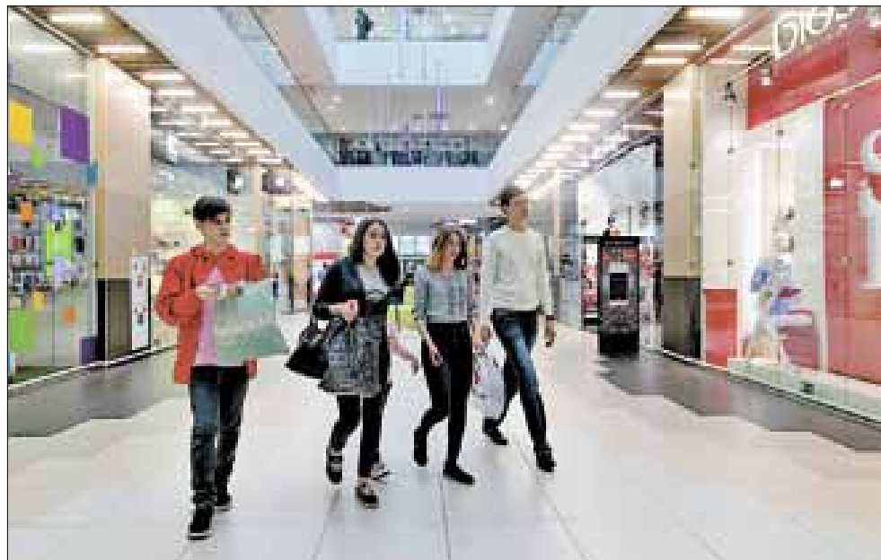
■ «Титан Арена» – это площадь 60 тысяч квадратных метров, три входа, круговое движение без «тупиковых» галерей и множество современных магазинов