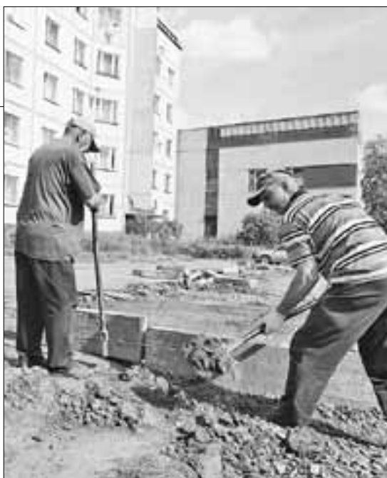
■ Во дворе по адресу: Штурманская, 10 идут ремонтные работы, они должны завершиться к концу сентября