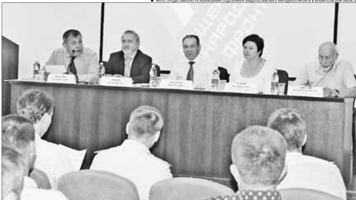
ФОТО: ПРЕДОСТАВЛЕНО РЕГИОНАЛЬНЫМ ОТДЕЛЕНИЕМ ОБЩЕРОССИЙСКОГО НАРОДНОГО ФРОНТА В АРХАНГЕЛЬСКОЙ ОБЛАСТИ

наводнений, землетрясений – тому, с чем большинство из них в жизни никогда не столкнется. А то, с чем ребенок сталкивается ежедневно, ведь он каждый день становится участником дорожного движения как пешеход или пассажир, – это мы преподаем факультативно. С 1 сентября в школах хотят ввести изучение астрономии как предмета – получается, что как ориентироваться по звездам, мы детей на-